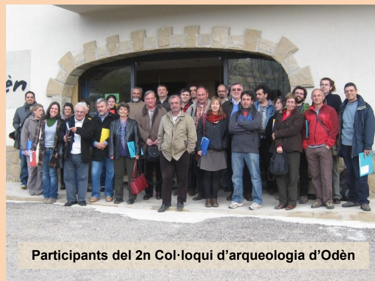
Participants del 2n Col·loqui d'arqueologia d'Odèn