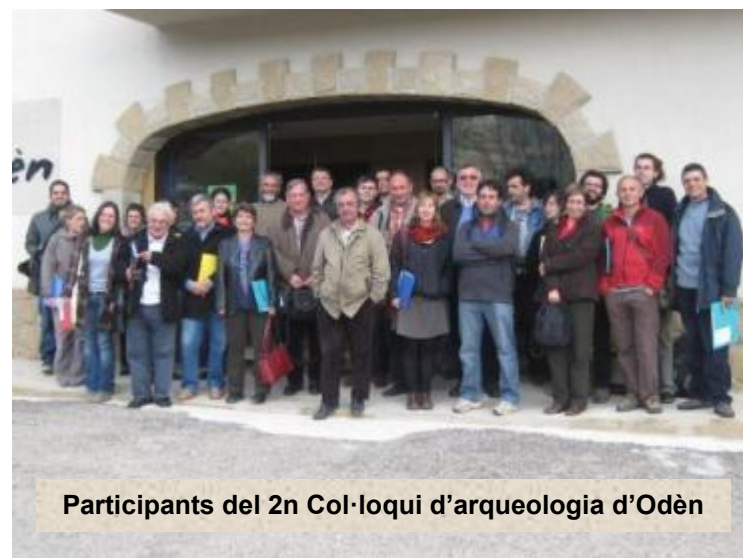
Participants del 2n Col·loqui d'arqueologia d'Odèn